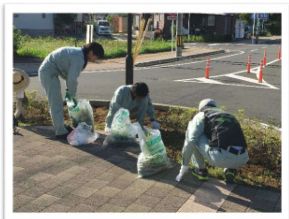
クリーンアップ三股 平成 29 年 7 月 2 日