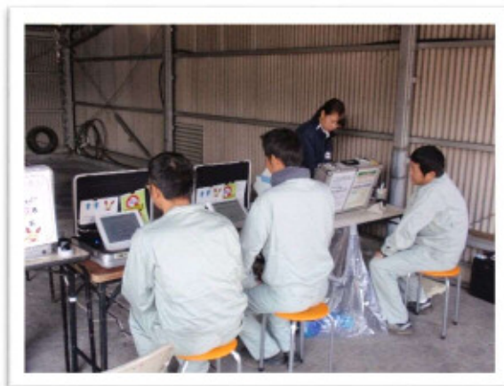
献血 平成 29 年 12 月 7 日