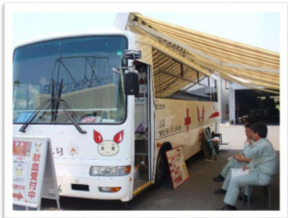
献血 平成 29 年 6 月 5 日